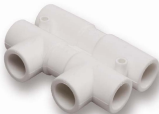
Распределительный узел D 20, 25 мм