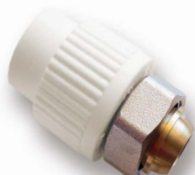
Евроконус с накидной гайкой D 20 мм