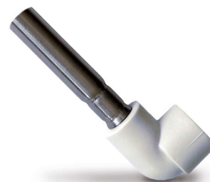
Подключение к радиатору угольник 90°