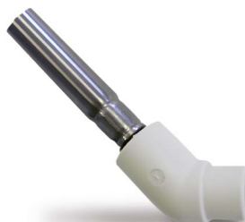
Подключение к радиатору угольник 45°